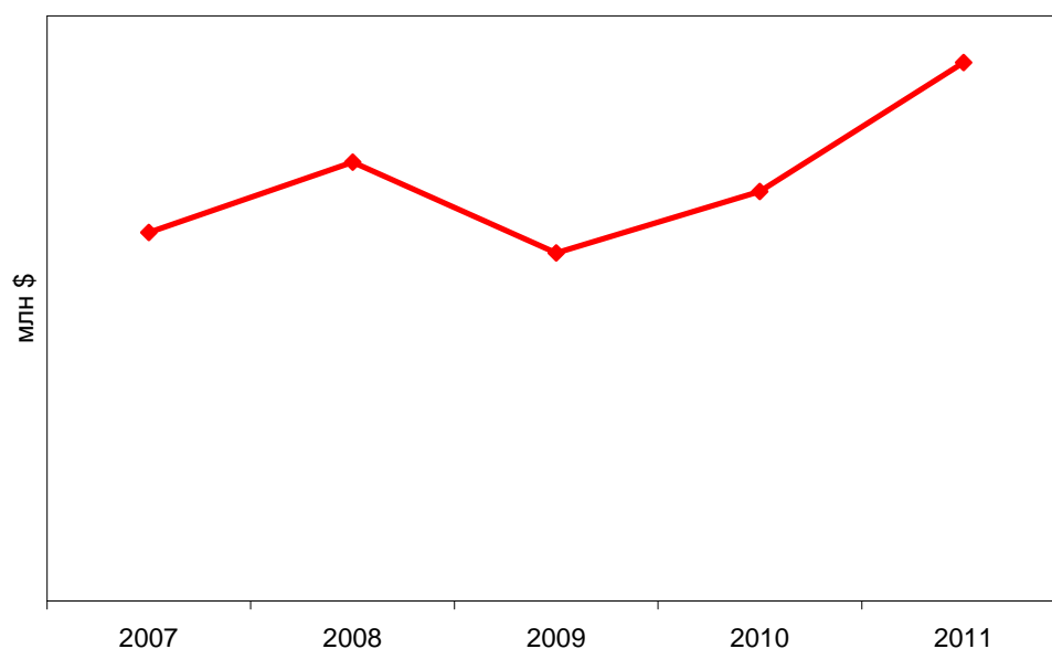
Рисунок 3. Динамика импорта белого цемента в Россию в стоимостном выражении в 2007-2011 гг.

Источник: оценка "..." на основе данных ФТС РФ